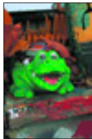
Vihreä sammakko luontuu hyvin talon varustukseen.

Osa tavaroista on peräisin Ilvesviidan merimiesamkollista. Keski-Pasilan kummallinen