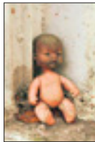
Ruusut koristelet saivat alkunsa ikkunalaudan nukeista.

tyttärieni asetteli ystävineen nukkeja ikkunalaudalle. Lelut jäivät siihen, ja jostakin vain tullut lisää."